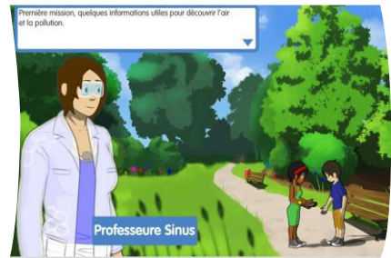
Professeure Sinus, Zack et Zélie dans le parc – mission 1

Sauver un futur trop pollué en mode « agents secrets » : enquête sur les origines et les effets de la pollution de l'air, recherche d'indices et de bons gestes pour améliorer la qualité de l'air. Le(s) utilisateur(s) du jeu mène(nt) l'enquête avec les personnages.