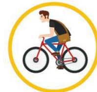
Vignette : « Pour les petits trajets, pense à prendre les transports doux : marche à pied, vélo, trottinette, etc. »

Chaque jeu gagné permet de récolter des vignettes « gestes à favoriser » ou « geste à éviter » . Elles seront utiles en fin de jeu pour éditer le diplôme.